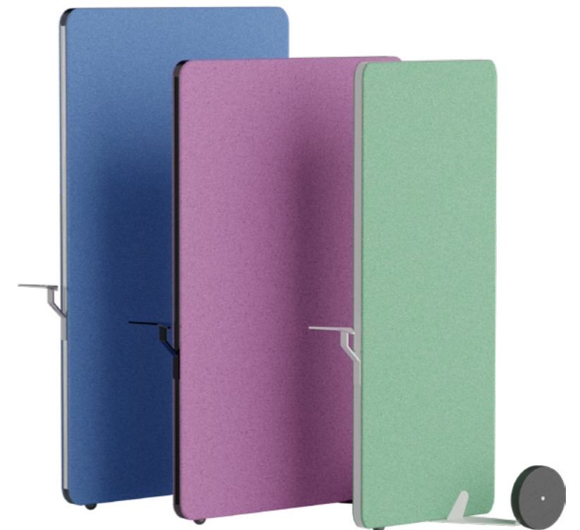
Sämtliche Größen auf Anfrage verfügbar