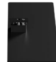
Standfuß Schwarz RAL9005