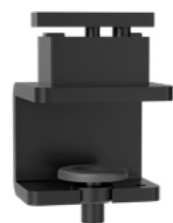
Auftisch-Adapter Schwarz RAL9005