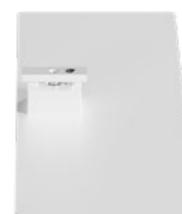
Standfuß Weiß RAL9016