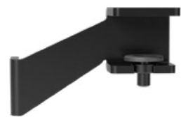
Hintertisch-Adapter Schwarz RAL9005