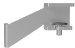
Hintertisch-Adapter Weiß Alu RAL9006