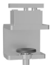
Auftisch-Adapter Weiß Alu RAL9006