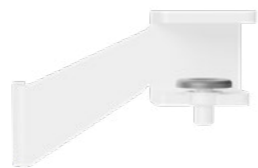
Hintertisch-Adapter Weiß RAL9016