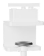
Auftisch-Adapter Weiß RAL9016