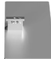
Standfuß Weiß Alu RAL9006