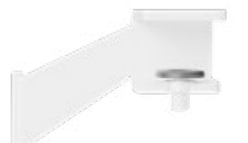
Hintertisch-Anbindung Weiß Alu RAL9006