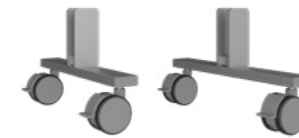
Rollen Set Weiß Alu RAL9006