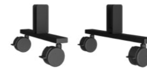
Rollen Set Schwarz RAL9005