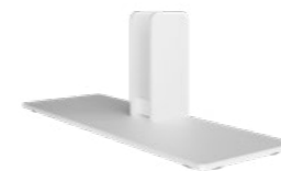
Standfuß Weiß RAL9016