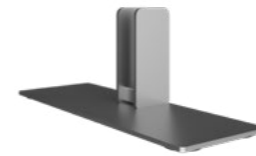
Standfuß Weiß Alu RAL9006