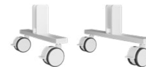
Rollen Set Weiß RAL 9016