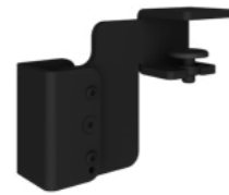
Hintertisch-Adapter Schwarz RAL9005