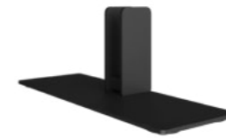
Standfuß Schwarz RAL9005