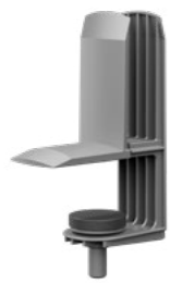
Auftisch-Adapter 8 Weiß Alu RAL9006