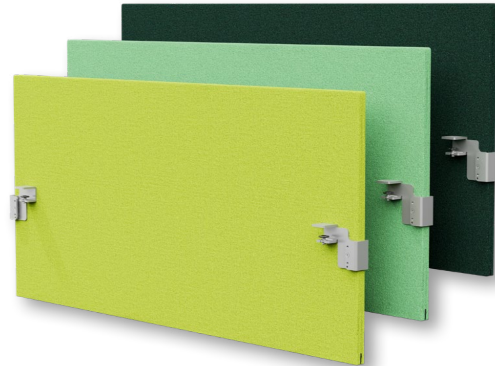
Sämtliche Größen auf Anfrage verfügbar