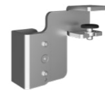
Hintertisch-Adapter Weiß Alu RAL9006