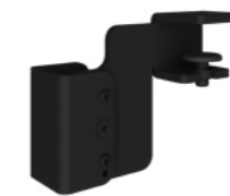
Hintertisch-Adapter Schwarz RAL9005