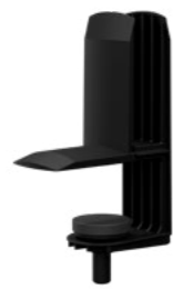
Auftisch-Adapter 8 Schwarz RAL9005