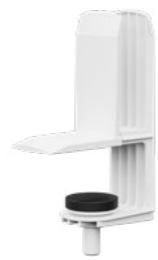
Auftisch-Adapter 8 Weiß RAL9016