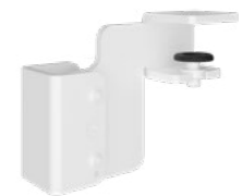
Hintertisch-Adapter Weiß RAL9016